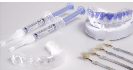
Trägerfolie (links unten) für das Bleaching-Gel (links oben)

Anschließend werden sogenannte Trägerfolien hergestellt. Das sind dünne flexible Folien aus Kunststoff, in die Sie später das Bleaching-Gel füllen.