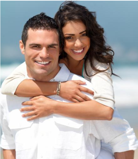
Home-Bleaching: Attraktivität und Ausstrahlung mit hellen Zähnen

Zahnaufhellung zu Hause mit Unterstützung durch den Zahnarzt