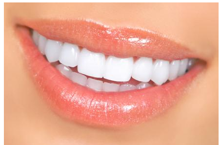
Power-Bleaching: Sichtbar hellere Zähne nach einer Stunde

Was kann man tun, wenn nur ein einzelner Zahn dunkel ist? Auf der nächsten Seite finden Sie Informationen zur Einzelzahn-Aufhellung!