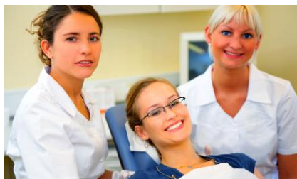
Regelmäßige Professionelle Zahnreinigung in der Praxis hält die Zähne hell und schützt vor Karies, Parodontose und Mundgeruch

Das hält nicht nur die Zähne länger hell. Es schützt sie auch vor Karies und Parodontose und es vermindert möglichen Mundgeruch .