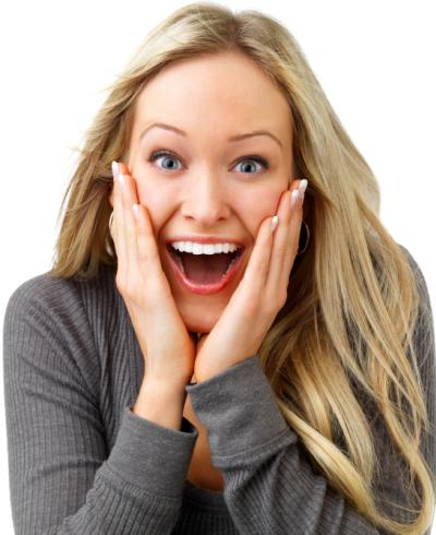
Power-Bleaching: Nicht zu fassen wie schnell die Zähne so hell werden