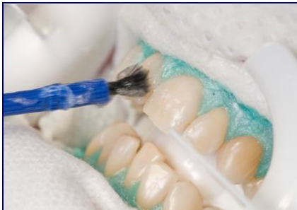
Nachdem das Zahnfleisch mit einem Schutz abgedeckt wurde, kommt das Bleaching-Gel auf die Zähne

Bevor das eigentliche Bleaching beginnt, muss das Zahnfleisch mit einem speziellen Schutz abgedeckt werden.